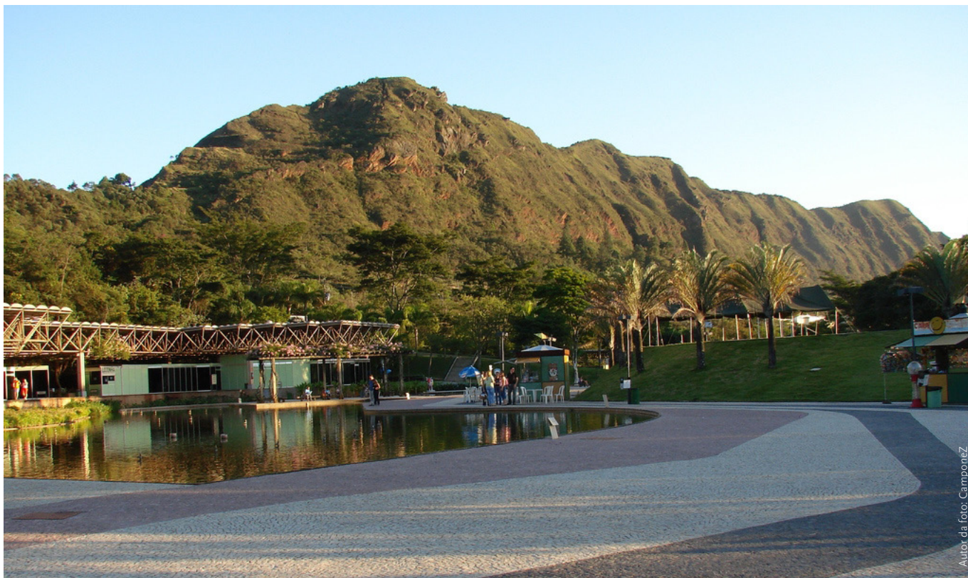
Parque das Mangabeiras com a Serra do Curral ao fundo, em Belo Horizonte, Minas Gerais

O sistema de drenagem natural do Município de Belo Horizonte é constituído por dois riberões principais, da Onça e Arrudas. As nascentes e cabeceiras de ambos, no entanto, estão localizadas no Município de Contagem. As condições naturais da hidrografia foram alteradas significativamente, com exceção de algumas áreas de preservação e a encosta da Serra do Curral. Nas áreas centrais da cidade todos os cursos d'água foram canalizados, alguns simplesmente revestidos, porém a grande maioria se encontra confinada em canais fechados (AROEIRA, 2010).